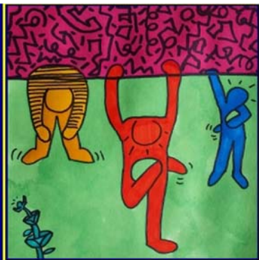
Haring (21 jan)