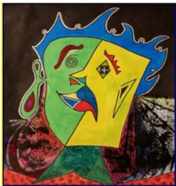
Picasso (14 jan)