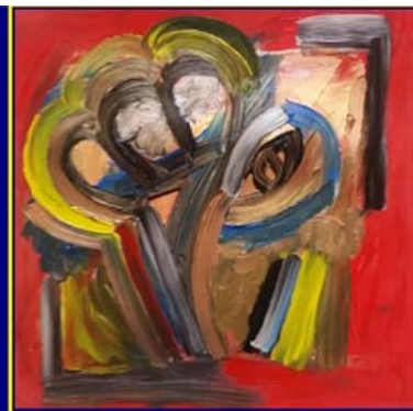
Appel (28 jan)