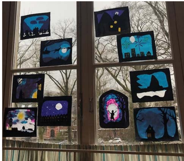
Transparanten gemaakt door leerlingen van klas 6 HP