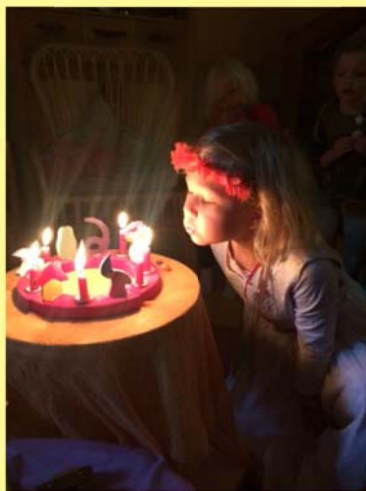
verjaardagsritueel kleuterklas Corry-An

Er kunnen geen euritmieschoenen meer gekocht worden op school. Er zijn op internet meerdere verkooppunten, maar wij raden aan om ze te kopen op www.euritmieschoenen.nl . Dit is de leverancier waar ook de ouderbibliotheek gebruik van maakte en ze zijn ook voordeliger dan andere verkopers. Een alternatief is de winkel Rozemarijn in Zeist waar ze ook via de webshop besteld kunnen worden ( www.rozemarijn.nl ). Graag witte of zwarte schoentjes bestellen.