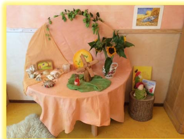
De jaartafel in de kleuterklas is klaar voor de ontvangst van de kinderen